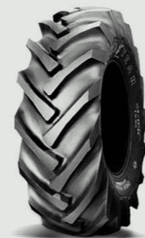
SURE GRIP ALL SERVICE R-1