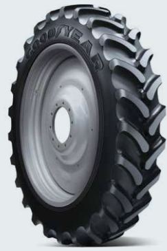
ULTRA SPRAYER R-1