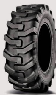
SURE GRIP INDUSTRIAL TRACTOR R-4