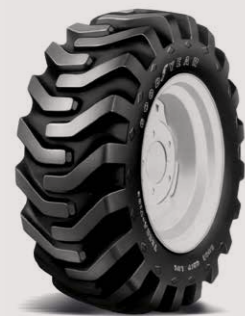
SURE GRIP LUG I-3