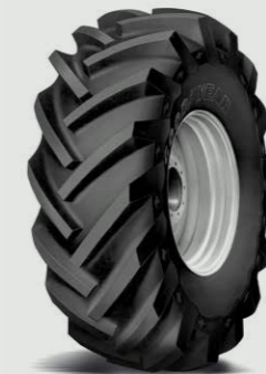
TRACTION SURE GRIP R-1